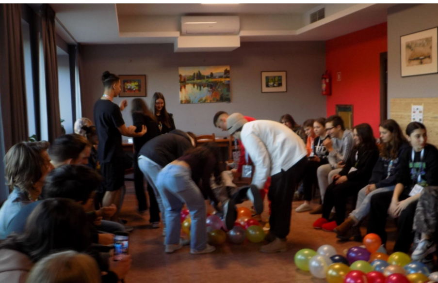
Ilustracja 2. Przykład działań integracyjnych realizowanych w trakcie projektu międzynarodowego