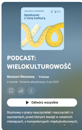
Ilustracja 4. Wizualizacja podcastu Wielokulturowość 4

z Ukrainy. Materiał zwraca uwagę na wagę kompetencji międzykulturowych, na przeżywaną traumę, jej przebieg i następstwa. Zawiera przede wszystkim dużo wskazówek do pracy z dziećmi.