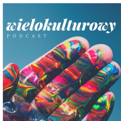
Ilustracja 3. Wizualizacja kanatu tematycznego Spotify 3

lokulturowości i międzykulturowości w warunkach polskich warto polecić Wielokulturowy Podcast , który powstał jako część projektu „Wiele kultur – jeden Kraków”. Podcast opowiada o różnorodności kulturowej Krakowa i całej Polski poprzez rozmowy z pracującymi w instytucjach kultury przedstawicielami różnych kultur, z członkami społeczności.